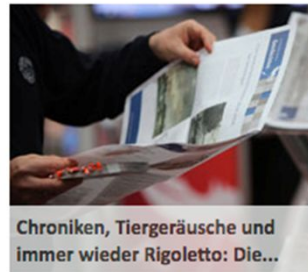
Chroniken, Tiergeräusche und immer wieder Rigoletto: Die...