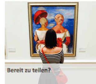
Bereit zu teilen?