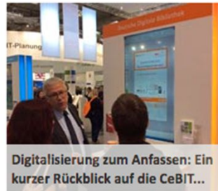
Digitalisierung zum Anfassen: Ein kurzer Rückblick auf die CeBIT...