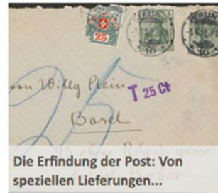
Die Erfindung der Post: Von speziellen Lieferungen...